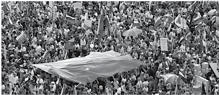
Situação política econômica tem levado milhares de venezuelanos às ruas para protestar contra o governo de Nicolás Maduro, que está em um ralo e sem nenhuma solução para os problemas.

A decisão do Supremo também foi criticada pela procuradora-geral da República venezuelana, Luisa Ortega - considerada pelos opositores uma aliada dos chavistas, que estão no poder há dezito anos. Ela disse que a medida constituía uma "ruptura da ordem constitucional e que tinha a