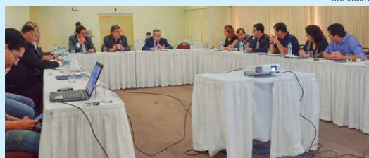
Reunião da CTI-Nordeste para a realização da Brazil National Tourism Mart (BNTM2017) que será em Salvador