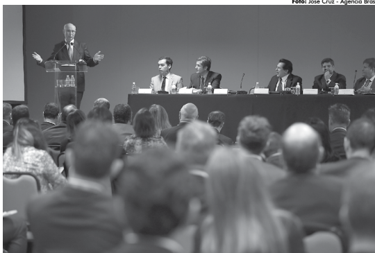
Ministro Ives Gandra falou sobre a reforma Trabalhista no 9º Encontro Interempresarial de Jurídico Trabalhista.

A aprovação do projeto pelos deputados ocorreu sob forte protesto de