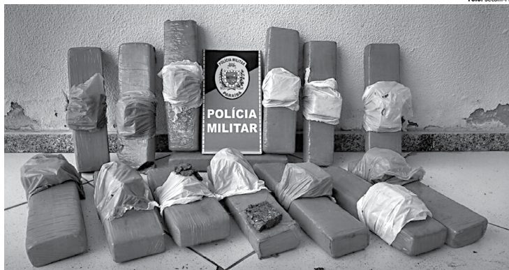
Arma e maconha apreendidas estavam acondicionadas em pacotes prontos para o consumo em dois bairros de João Pessoa.

A PRF contou, aqui na Paraíba, com apoio de órgãos estaduais e municipais ao longo de toda a operação. Polícia Militar (BPTTran), Secretarias Municipais de Trânsito, com destaque para as Semob João Pessoa e Semob Cabedelo, Detran e DER foram os grandes parceiros da ação.